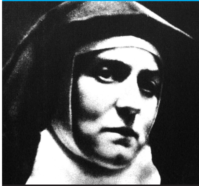
Centrum Badań im. Edyty Stein